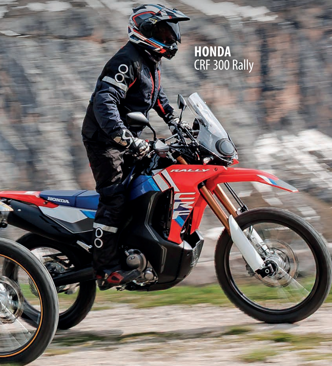
HONDA CRF 300 Rally

Men den kule nonchalansen forsvinner raskt, spesielt på Hondaen. Den imponerer absolutt ved første øyekast med en setehøyde på 900 millimeter (Voge har til og med 920 millimeter), men så snart man setter seg på den smale salen, kollapser CRF 300. Til