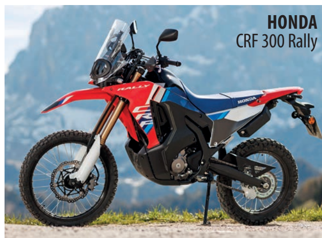
Tre poengs forsprang holder: CRF er i finalen.