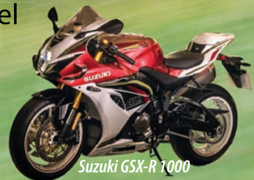
Suzuki GSX-R 1000