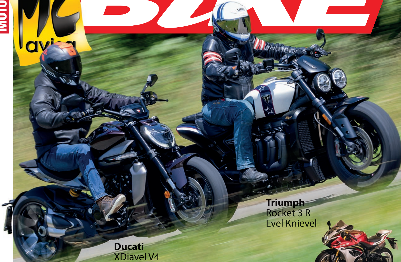
Ducati XDiavel V4